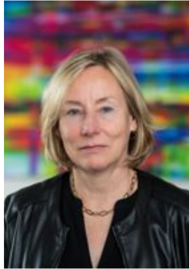
Bettina Gayk Landesbeauftragte für Datenschutz und Informationsfreiheit

Durch die DS-GVO sind alle unabhängigen Datenschutzaufsichtsbehörden darauf verpflichtet, die Regelungen der Verordnung einheitlich anzuwenden. In Europa wird dies durch den Europäischen Datenschutzausschuss (EDSA) und seine Fachuntergruppen (Expert Subgroups) gewährleistet. Hier arbeiten die jeweiligen Fachleute aus meiner Behörde in vielen Bereichen mit und tragen so aktiv dazu bei, dass eine rechtssichere und einheitliche Anwendung der DS-GVO gelingt. Sehr aktiv sind wir beispielsweise im Themenfeld der Selbstregulierung. Nach gewissen Anlaufschwierigkeiten tut sich hier inzwischen einiges. Wir haben das erste deutsche Zertifizierungsverfahren im EDSA abstimmen können und konnten im Anschluss die erste deutsche Zertifizierungsstelle akkreditieren. Diese bietet Auftragsverarbeitern nun die Möglichkeit der Zertifizierung ihrer Verfahren. Unternehmen oder andere Stellen, die Auftragsverarbeiter nutzen wollen, können deren Eignung nunmehr aufgrund der Zertifikate besser beurteilen.